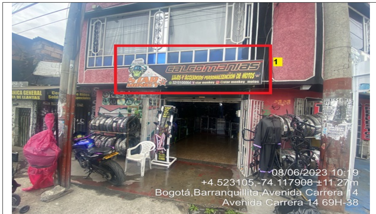
En la cual se evidencia la fachada del establecimiento comercial STAR MONKEY con vista hacia la CR 14, en la que se observa: un (1) elemento publicitario identificado con el número 1, el cual se encuentra saliente de la fachada del establecimiento comercial.