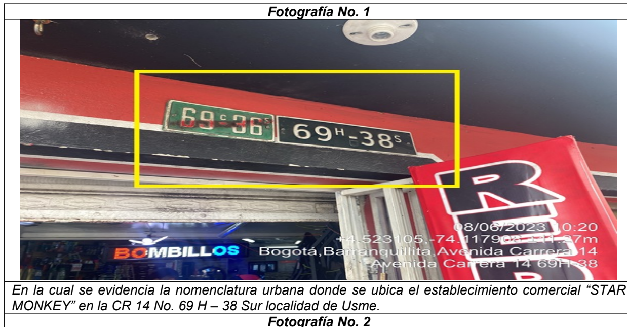
Fotografía No. 1

En la cual se evidencia la nomenclatura urbana donde se ubica el establecimiento comercial “STAR MONKEY” en la CR 14 No. 69 H – 38 Sur localidad de Usme.